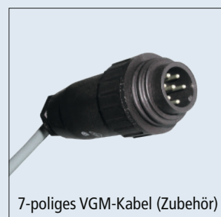
7-poliges VGM-Kabel (Zubehör)

Die Geschwindigkeit wird über GPS ermittelt und an das Bedienteil weiter gegeben.