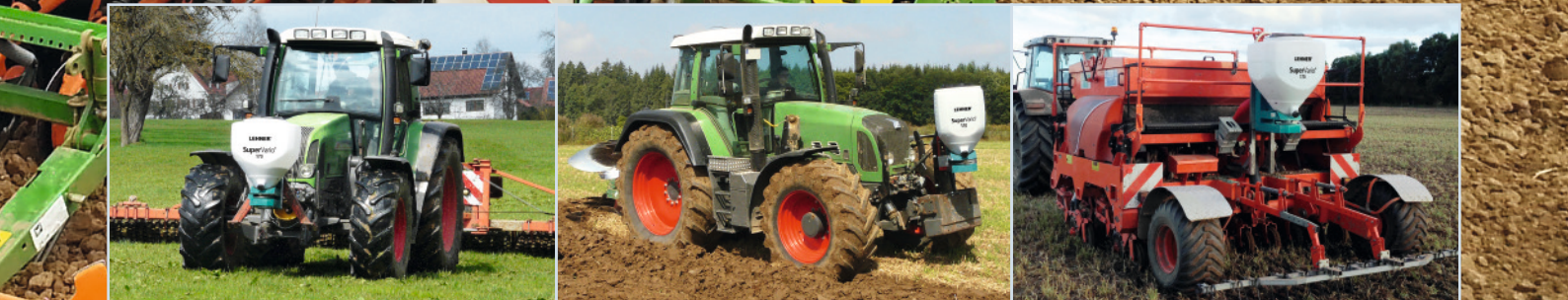
Grünland-Übersaat mit Walze